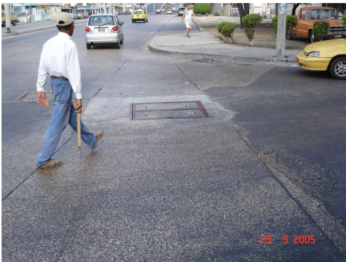
Obr 04. Velká část měřících šachet se nalézá pod (mnohdy rušnými) komunikacemi

3. Soustava vodojemů pokrývá dostatečně celou zásobovanou oblast. Vodojemy však nejsou efektivně využívány.