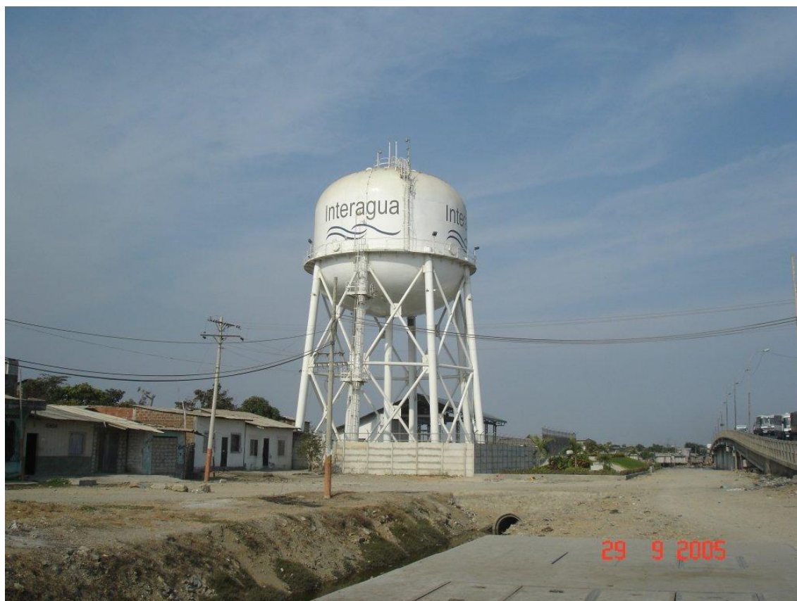
Obr. 05 Typický tvar vodojemů používaných v Ekvádoru

4. Výrobní kapacita úpravny vody je dostatečná, ale jen v případě výrazného snížení ztrát vody ve vodovodní síti (původní ztráty dosahovaly 81% vyrobené vody).