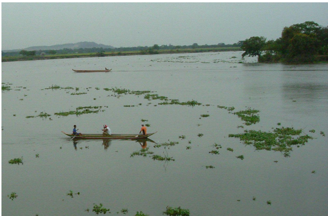
Obr 1. Řeka Daule, zdroj surové vody

Surová voda se čerpá přímo z blízké řeky Daule. Je nutné podotknout, že řeka Daule není ohraničena žádnými ochrannými pásmy a na jejím dolním toku se provozuje běžná lodní doprava. Čerpání se realizuje pomocí 4 na sobě nezávisle fungujících čerpacích stanic, které jsou mezi sebou částečně propojeny na armaturním uzlu. Celkem zde pracuje 20 čerpadel o celkovém výkonu cca 23 m 3 /s. Z toho v největší a nejnovější čerpací stanici č. 4 je instalováno 8 čerpadel, každé s výkonem 1,7 m 3 /s. Čerpadla jsou na vstupu chráněna soustavou hrubých a jemných česlí.