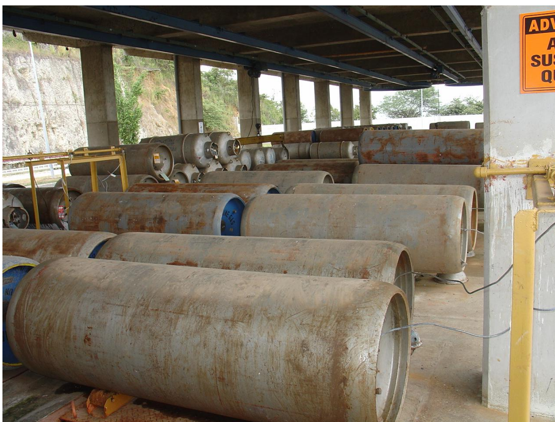
Obr. 03 Sklad nádob na plynný chlor

Za filtry se provádí ještě hygienické zabezpečení plynným chlorem. Tuto potenciálně nebezpečnou metodu je zde možné použít, neboť mezi úpravou a vlastním spotřebišťem je jednak poměrně velká vzdálenost a také několik armaturních uzlů a vodojemů, kde je možné v případě havárie zabránit kontaminaci distribuční sítě chlorem. Dodatečná chlorace se pak provádí i na vodojemech avšak bez použití plynného chloru.