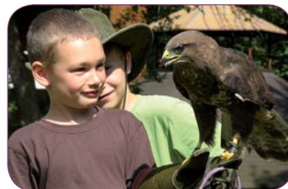
Líska, o. s., získala 25 000 Kč na projekt Ptáci – žijí tady s námi... Peníze byly použity na přípravu a realizaci šesti vzdělávacích a osvětových akcí pro děti a mládež a veřejnost ve Zlínském kraji.