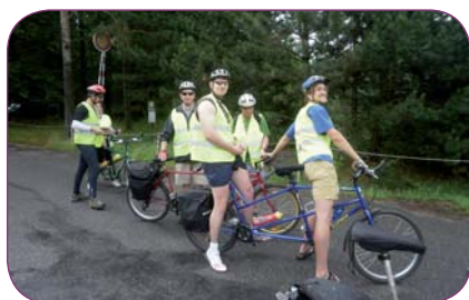
TyfloCentrum Olomouc, o. p. s., obdrželo 18 000 Kč na outdoorové aktivity pro zrakově postižené, na fotografii je záběr z vyjíždky na dvoukolech s instruktory.

ren, tak i v místě svého bydliště. Důležitou součástí žádosti je, aby byl zaměstnanec aktivním členem podpořeného projektu nebo případně jeho tvůrcem. Více informací k vybraným projektům a minulým ročníkům najdete na www.nfveolia.cz/projekty/minigranty/ .