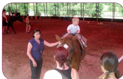
Středisko rané péče Educo Zlín, o. s., dostalo 20 000 Kč na zkvalitnění života postižených dětí a jejich rodin, na fotografii je momentka ze setkání rodin v Koryčanech.