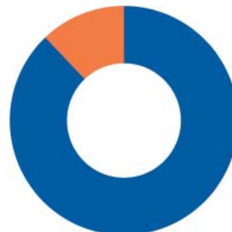
Používáte vodu z kohoutku také na pití?

% a s jejich kvalitou 86 % respondentů, webové stránky dodavatele navštívilo 14 % respondentů a 94 % z nich bylo spokojeno s jejich přehledností. Zákaznické centrum, podobně jako v loňském roce, navštěvují výrazně častěji zástupci bytových družstev, kteří také projevili větší znalost služby SMS Info (39 %) a zaslání faktur