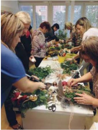
Výroba vánočních věnců ve Slunečnici ve Zlíně

Firemního dobrovolnictví se vodáři z Moravské vodárenské, a. s., účastní pravidelně na jaře a na podzim. Skupiny nadšených dobrovolníků pomáhají v chráněných dílnách i při úklidu v přírodě.