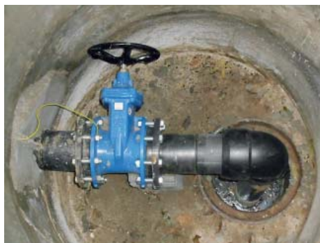
Nové vystrojení studní

Oba násoskové řady budou opraveny bezvýkopovou technologií relining, spočívající v nedestruktivním zatažení nového polyetylenového potrubí do stávajícího litinového potrubí, a to po jeho mechanickém vyčištění a monitoringu. U opravovaných studní bude současně provedeno i jejich vyčištění, výměna vystrojení studní, včetně nových žebříků a poklopů z kompozitních materiálů. Vzhledem k zanášení potrubí byl navíc násoskový řad N16 nově osazen čistícími kusy pro jeho snadné čištění. Generální oprava násoskového řadu N16 by měla být dokončena do konce listopadu 2015 a oprava dalšího násoskového řadu N4 je naplánována na rok 2016.