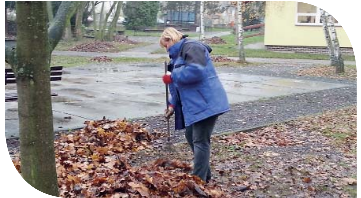
Úklid zahrady centra JITRO v Olomouci

Letos v květnu se prostějovští v rámci akce Give & Gain Day spolu se zástupci Českého svazu ochránců přírody - Regionálního sdružení IRIS Prostějov pustili opět do kultivace biokoridoru řeky Hloučely. Připojili se tak k desítkám různých dobrovolnických akcí po celé České republice, během nichž zaměstnanci českých firem pomáhali ve veřejně prospěšných organizacích zaměřených na nejrůznější společenské problémy nebo pečovali o mnohá chráněná přírodní území. Zlínští kolegové se uplatnili v tréninkových dílnách netradičního centra