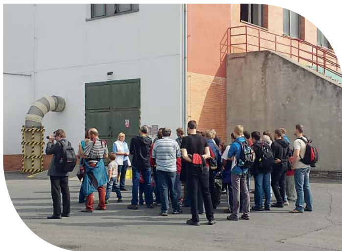
Návštěvníci na ČOV Olomouc

Pořadatelem Dnů evropského dědictví v České republice se stalo Sdružení historických sídel Čech, Moravy a Slezska. Památky znovuzrození – takové bylo téma letošního ročníku Dnů evropského dědictví, který se uskutečnil od 5. do 13. září. Dny otevřených památek připadly na víkend