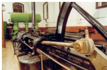
Historická čerpací stanice Chvádkovice

Dny evropského dědictví se staly významnou celoevropskou kulturně poznávací, společenskou a výchovnou akcí. V září se každoročně otevírají nejširší