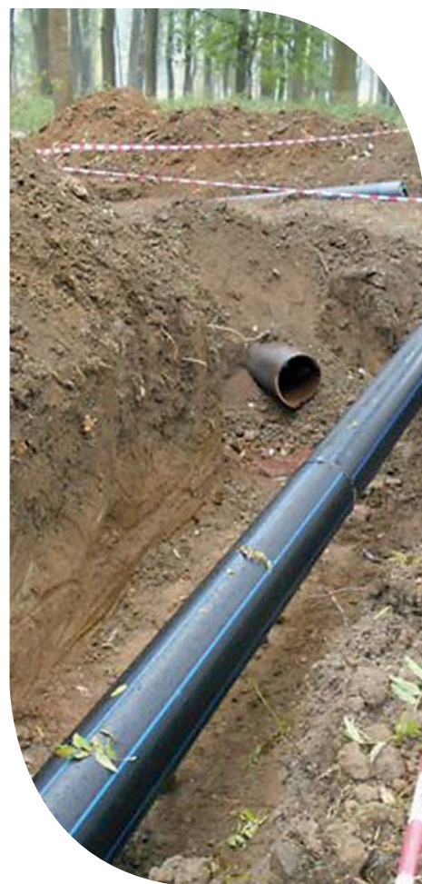
Vtahování nového PE potrubí – relining