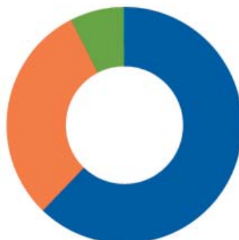
Jste spokojen/a s kvalitou pitné vody?

62,1 ano, velice 30,3 spíše ano 7,4 spíše ne 0,1 vůbec ne